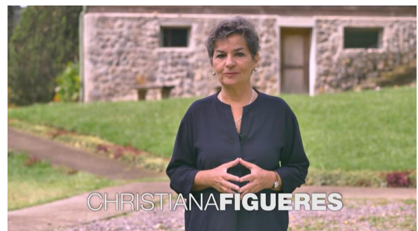
Christina Figueres - former Executive Secretary of the UN Framework Convention on Climate Change (UNFCCC)

https://www.globaloptimism.com/why-stubborn-optimism