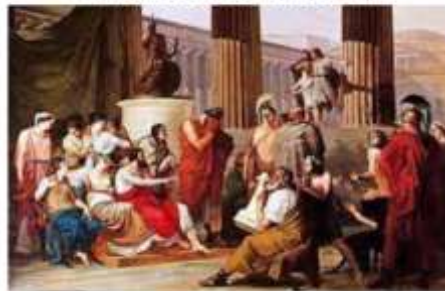
Η φιλοξενία του Οδυσσέα από τους Φαίακες.

Τον πηγαίνει τώρα αυτή την ιστορία του να πει, που όταν όλοι την ακούν τα δάκρυα τους δε σταματούν.